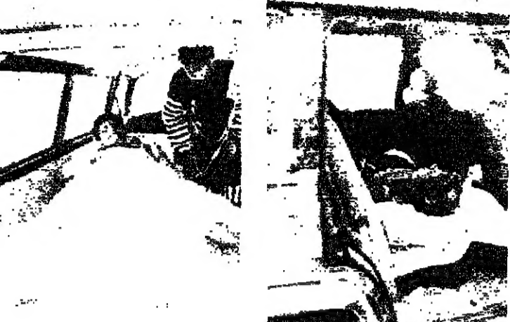
جرحى أجلوا من أرض المعركة في الأقليم